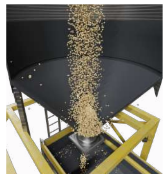
✓ Revestimiento de silo