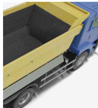
✓ Cubo de camión