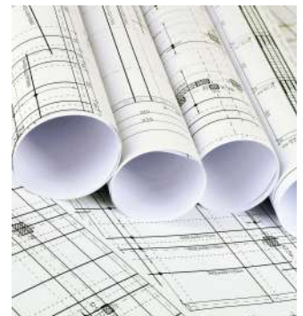
✓ Piezas especiales