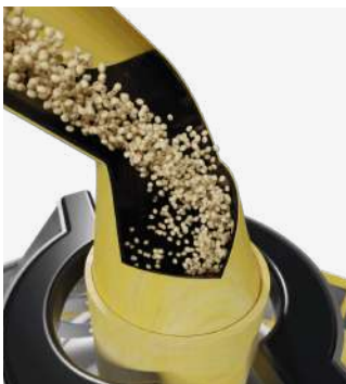
✓ Tubos / Ductos