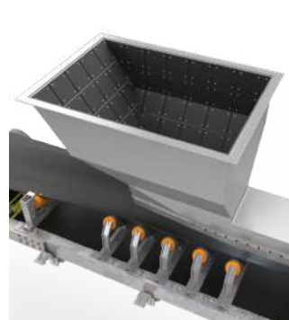
✓ Canales de transferencia